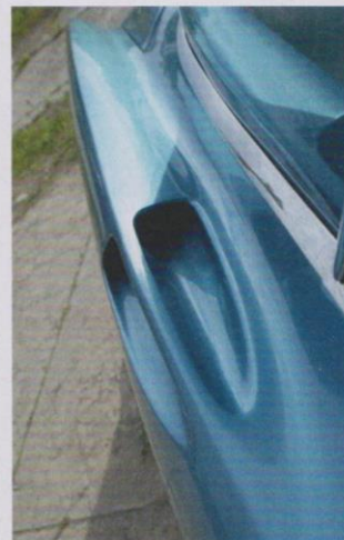
Die Lufteinlässe dienen nicht der Bremskühlung, sondern versorgen die Klimaanlage.

Auch Verarbeitungs- und Materialgüte lassen so ziemlich jedes zeitgenössische Fahrzeug alt aussehen; dass das Montageband erheblich langsamer als bei den übrigen FoMoCo-Divisionen lief, trug ebenfalls maßgeblich zur enormen Qualität bei. Der Innenraum mit dem großzügig verlegten Leder, den flauschigen Teppichen, in deren Genuss auch die Koffer im Gepäckabteil kamen, sowie die geriffelten und eloxierten Metalloberflächen am Armaturenbrett wirken noch heute gediegen und dezent. Die einzige Verspieltheit leistete sich Continental im Innenraum mit den von der Luftfahrt inspirierten Schieberegler auf der Mittelkonsole und den Schubreglern nachempfundenen Türöffnern. Aber nun, so war das im Jetzeitalter eben.