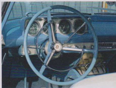
Edle Materialien und eine komplette Instrumentierung adeln das Cockpit.