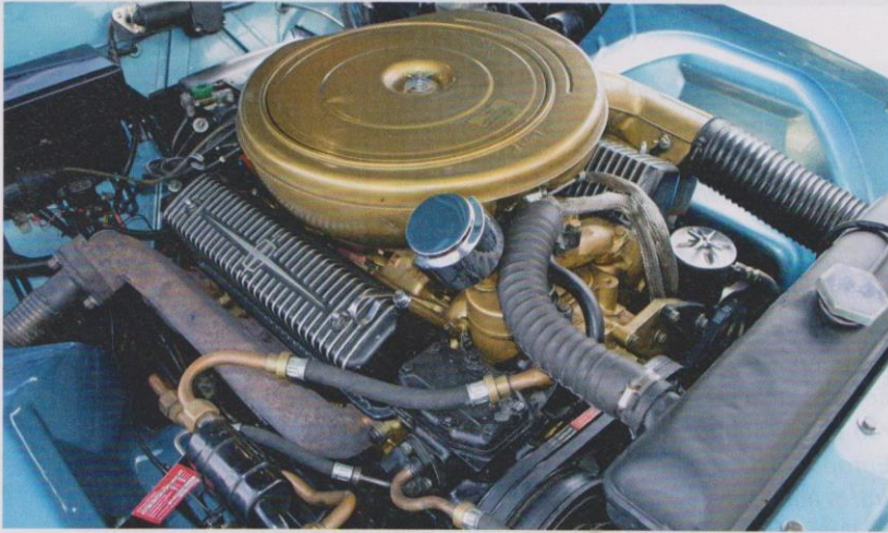
Für den 368 ci V8 kamen nur die besten Teile mit geringsten Toleranzen in Frage.

Zudem war der Hauptrivale Rolls-Royce zu Gast an der Seine. Und in dessen Revier wollte man Kunden wildern. Angesichts eines Basispreises von rund 7.400 Dollar war der im direkten Vergleich regelrecht schwülstige Silver Cloud I ein ebenbürtiger Gegner. Als einzige