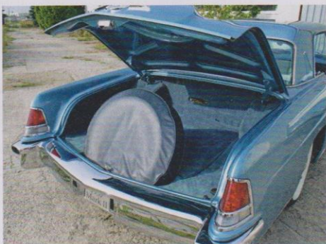
Praktisch geht anders, spartanisch auch – der mit weichem Teppich ausgeschlagene Gepäckraum