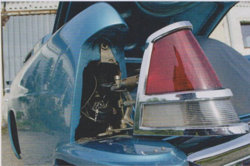
Tanke schön: Der Tankdeckel sitzt hinter dem abklappbaren linken Rücklicht.

Die endete mit einer Anzahlung, und kurz nach dem Brandenburger traf auch der Amerikaner in der alten Welt ein. Als Luxus Schlitten durfte es im Mark II an nichts fehlen, so waren eine Lederausstattung, Drehzahlmesser, Servobremsen und -lenkung, elektrisch arbeitende Sitzverstellung und Dreiecksfenster stets an Bord. Letztere waren womöglich nötig, wollte ein Kunde nicht weitere 595 Dollar für die Klimaanlage auf den Tresen legen – das einzige Extra. Die hinter der Rückbank platzierten Wärmetauscher der Klimaanlage wurden über die auf den Heckkotflügeln befindlichen Lufteinlässe beschickt. Diese Hutzen gab es zunächst aber nur bei den A/C-Versionen. Kein Wunder, dass Ford die Mark II-Reihe mit rund 1.000 Dollar pro Exemplar bezuschussen musste.