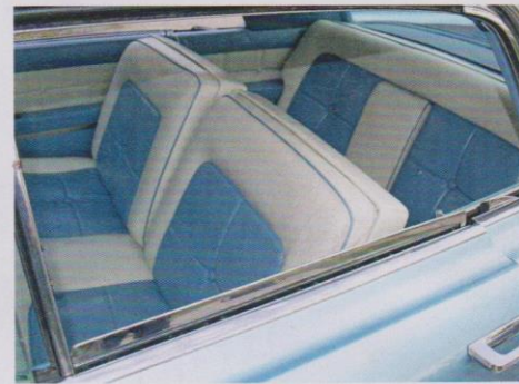
Echtes Leder sorgt im Innenraum für Gemütlichkeit.