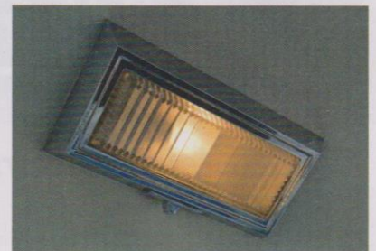
Auch an der Deckenlampe sparte Continental nicht, das Teil wirkt wie "aus dem Vollen geschnezt".