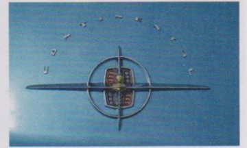
Den eingefassten Continental-Stern übernahm Lincoln als Emblem.

Kurz: Der neue Continental verkörperte gestalterisch das, was Amerikaner als europäisch und damit besonders erlesen erachteten. So war es auch kein Zufall, dass Fords Feinster nicht inmitten seiner niederen Landsmänner auf einer US-Motorshow, sondern in Europa auf dem Pariser Autosalon präsentiert wurde. Dort traf er auch auf die extrem rar gesäten Konkurrenten, speziell den stilistisch ebenfalls nüchternen und mit einem fetten US-V8 – allerdings von Chrysler – befeuerten Facel.