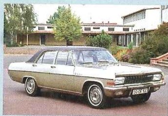
Einer der Ersten: Opel Diplomat A – ab 1964 war das Vinyl Dach Serie