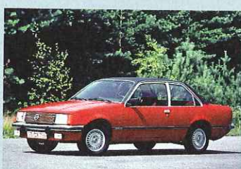
Bis 1982 mit schwarzer Kappe: Opel Rekord (Foto), Commodore, Manta