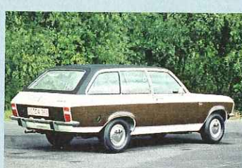
Ascona A Voyage: ein wenig Lack zwischen Vinyl, Chrom und Holzfolie