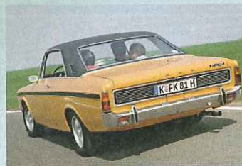
Start frei für die Kunststoffkappe bei Ford: 17M P7, hier als RS-Ausführung