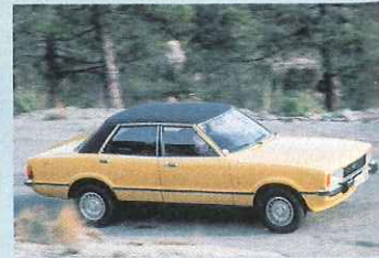
Auch den Taunus II gab's ab 76 als Zweitürer und Viertürer mit Vinyl