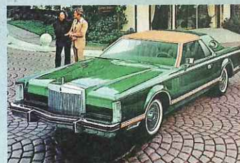
Lincoln Mark V Coupé von 1977 mit Vinyl Dach in „Canopy“-Ausführung

■ Knapp 20 Jahre dauerte die Boomzeit der Vinyl dächer in Deutschland. Bei Opel und Ford war die Angebotspalette am reichhaltigsten. Deutlich vielfältiger und ideenreicher: der US-Markt.