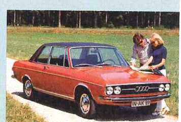
Von 1972 bis 1981 bot Audi das Vinyl als Option für die 80er und 100er an